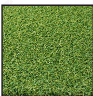
Césped artificial rizado