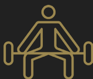
LEVANTAMIENTO DE PESAS