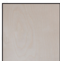
Madera de Abedul